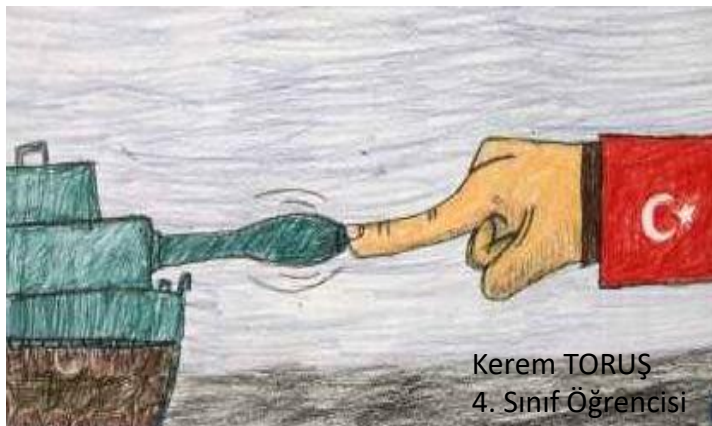
Kerem TORUŞ 4. Sınıf Öğrencisi