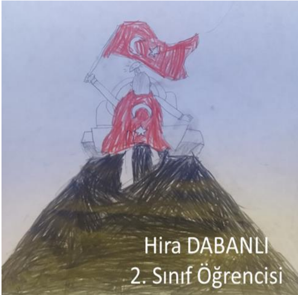
Hira DABANLI 2. Sınıf Öğrencisi