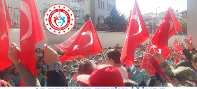
15 TEMMUZ ETKİNLİĞİNDE YÜREKLER VATAN AŞKIYLA ÇARPTI